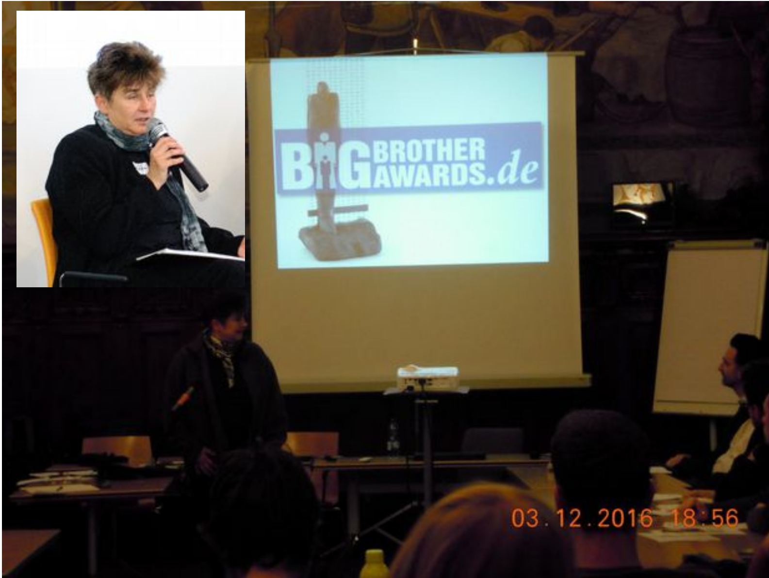
Rena Tangens - https://digitalcourage.de