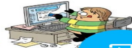
Illustration: Martin Vidberg

In alcuni casi, posso chiedere ai motori di ricerca di deindicizzare una pagina web che minaccia la mia privacy o chiedere ad un sito web di cancellare informazioni che mi riguardano.